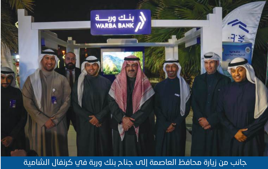
جانب من زيارة محافظ العاصمة إلى جناح بنك وربة في كرنفال الشامية