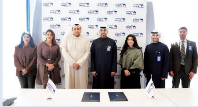
صورة جماعية أثناء توقيع اتفاقية الشراكة