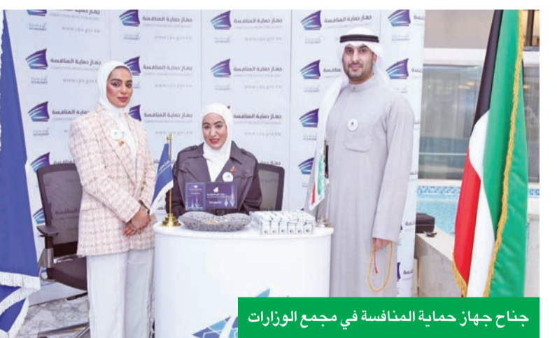
جناح جهاز حماية المنافسة في مجمع الوزارات

وتهدف المنافسة، التي تستمر ثلاثة أيام، إلى تعريف الجمهور بدور الجهاز واختصاصاته، وتسليط الضوء على أهمية المنافسة العادلة في دعم الاقتصاد الوطني وحماية المنافسة وخلق بيئة تجارية قائمة