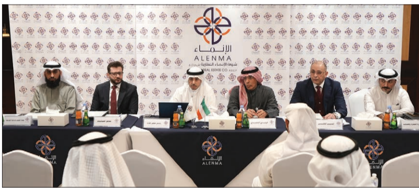
جانب من الجمعية العمومية

وافقت الجمعية العامة العادية لشركة الإنماء العقارية التي انعقدت أمس بنسبة حضور (58.735 %) على توزيع أرباح نقدية بواقع 5 % من قيمة السهم الاسمية (5 فلس لكل سهم) بمبلغ إجمالي يعادل 1.752.673 ديناراً عن السنة المالية المنتهية في 31 أكتوبر 2025.