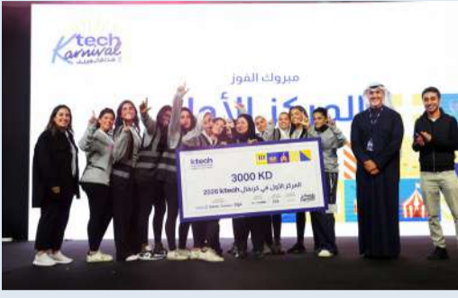
صورة جماعية للبنات

للمرحلة الجامعية. نحن نشكر جميع الراعي الإعلامي: حساب بتختر. وجدير بالذكر أن الكرنفال وفر جوائز وأنشطة متنوعة، حيث تجاوزت قيمة الجوائز