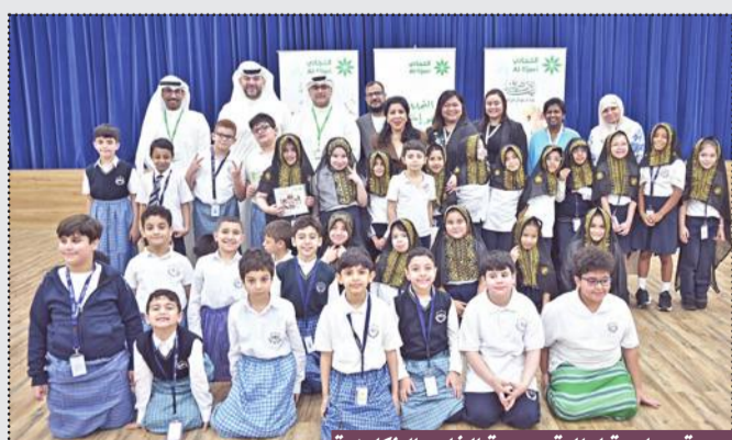
صورة جماعية لطلبة مدرسة الخليج الإنكليزية

وفي ختام الزيارة، عبرت إدارة مدرسة الخليج الإنكليزية عن شكرها وتقديرها للبنك التجاري الكويتي على هذه الزيارة، مشيدة بالدور الذي يقوم به البنك في المحافظة على التراث الكويتي القديم وتعريف جيل اليوم والغد بمآثر وتاريخ الأجداد، مما يساهم في تعزيز الهوية الوطنية لديهم.