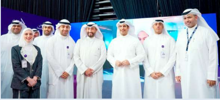
الوزير عبدالرحمن المطيري في جناح الشركة

ضمن قواها العاملة، مع توفير فرص النمو لهم في بيئة مبتكرة ومتجددة. كما تدرج هذه المشاركة في إطار برنامج المسؤولية المجتمعية الشامل للشركة، حيث يمثل التعليم، وتمكين الشباب من إحدى الركائز الأساسية لمبادرات stc المجتمعية. وانطلاقاً من نجاح الدورات السابقة، تواصل stc مشاركتها في معرض «وظيفتي»، كجزء من التزامها المستمر بدعم مبادرات التوظيف للكوادر الوطنية، وسد الفجوة بين مخرجات قطاع التعليم ومتطلبات القطاع الخاص. بالإضافة إلى ذلك، أقامت stc جناحاً خاصاً، يُتيح للزوار فرصة لقاء أعضاء من عائلة stc، الذين تبادلوا معهم رؤاهم حول سبل التطور الوظيفي والفرص الوظيفية المتاحة، وإجراءات التقديم، وثقافة بيئة العمل في الشركة، كما قدّم الجناح عروضاً حصرية، من خلال باقات الشباب من stc، المصممة لتلبية الاحتياجات الرقمية للعلماء الشباب. وتواجد ممثلو stc لتقديم مزيد من هذه الباقات، بالإضافة إلى حلول الاتصالات والحلول الرقمية الأخرى، التي تقدمها الشركة.