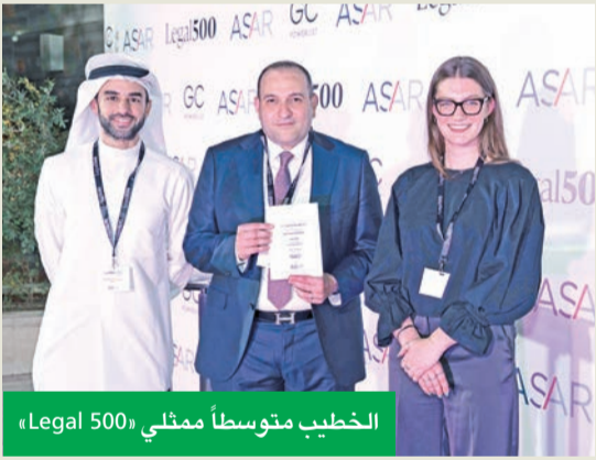
الخطيب متوسطاً ممثلي «Legal 500»