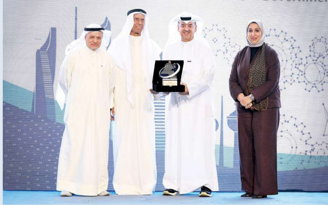
تكريم «زين» على دعمها السنوي للمنتدى