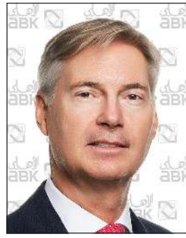
جيل جان فان دير تول