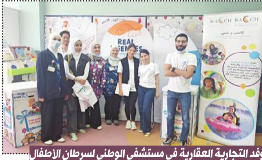
وقد التجارية العقارية في مستشفى الوطني لسرطان الأطفال

دافعاً للتعافي سريعاً، سائلين المولى عز وجل أن يمن عليهم بالشفاء العاجل». وفي ختام الزيارة، توجه فريق التسويق بالشكر إلى الجمعية الكويتية لرعاية الأطفال وبيت عبدالله لرعاية الأطفال (كاتش) على إتاحة الفرصة لهم للمشاركة في هذه الزيارة الإنسانية، والتفاعل مع الأطفال ومشاركتهم لحظات الفرح والأمل.